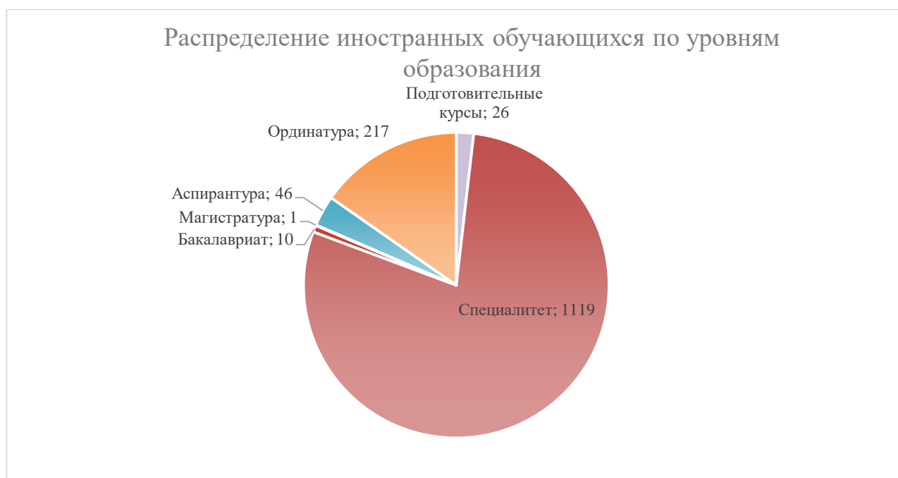
Диаграмма 1. Распределение иностранных обучающихся по уровням образования в РНИМУ им. Н.И. Пирогова