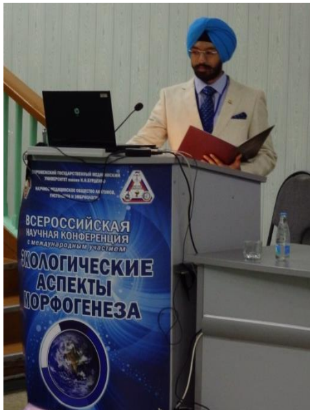
Рисунок 5. Выступление индийского студента на Всероссийской научной конференции в Воронеже, 2015 год

Результаты научных исследований иностранных обучающихся публикуются в изданиях регионального и всероссийского уровня. Также они выступают с устными и стендовыми докладами на различных научных конференциях (рисунок 5).