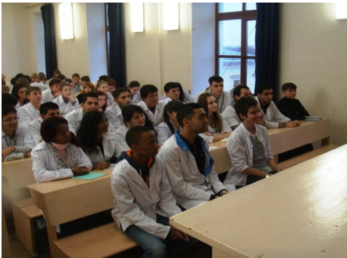
Рисунок 3. Лекция по гистологии у иностранных студентов

В настоящее время в нашем вузе обучаются более 1000 человек из разных стран (рисунок 3).